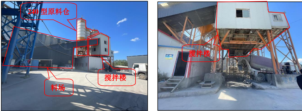
图 4-1 现场勘察情况