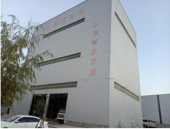
密闭搅拌机及筒仓