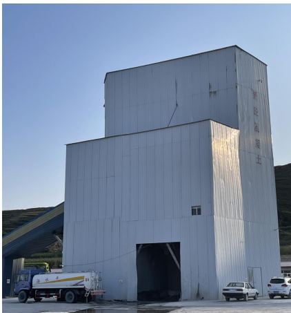
密闭搅拌机及筒仓