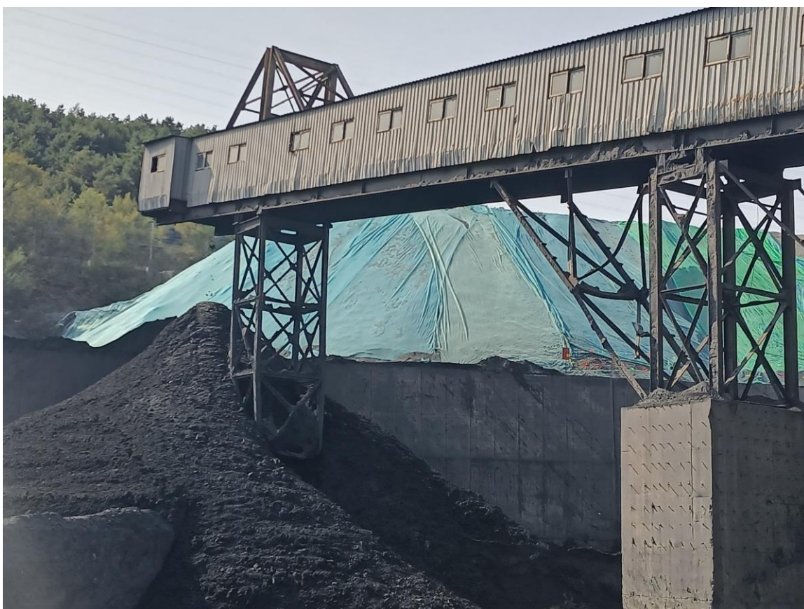
绿色覆盖部分为料场